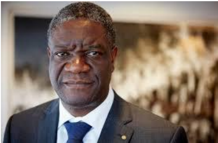
Dr. Denis Mukwege